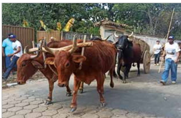
O Desfile de Carros de Boi aconteceu em frente ao Hospital Monumento às Mães