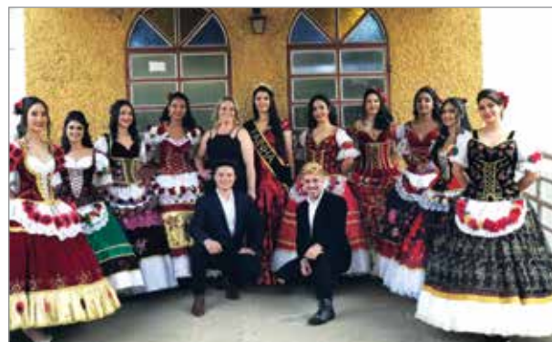
Comissão organizadora e a Rainha do Festival 2019 junto das candidatas ao título de Rainha do Festival de Carros de Boi 2021