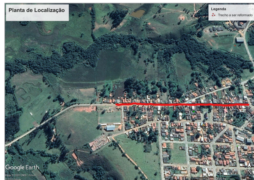
Planta de Localização Sem Escala