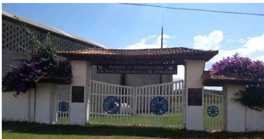
Foto 2: antigo portal do Parque de Exposições de Ibertioga, com a visada prejudicada por quadra poliesportiva, construída posteriormente ao parque.

Este novo portal corresponderá a uma releitura do partido arquitetônico do portal existente, com 2 acessos laterais destinados ao público e 1 acesso central para veículos, sendo todos estes protegidos por cobertura de madeira e telhas cerâmicas coloniais.