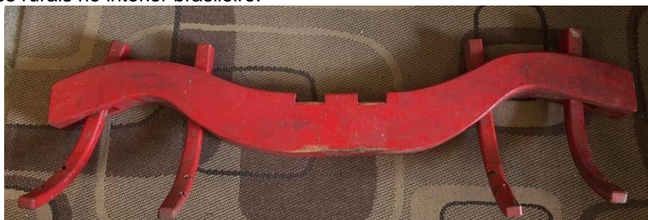
Foto 3: canga de carro-de-boi, que inspirou a concepção da viga intermediária do novo portal.

A viga intermediária de madeira, que sustenta as 2 coberturas laterais (sobre os acessos de pedestres), teve seu formato inspirado pelas cangas de carros-de-boi, objeto tradicional das atividades rurais no interior brasileiro.