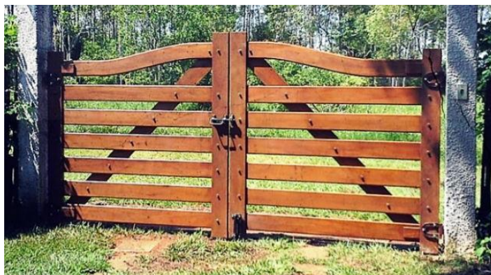
Foto 4: porteira de madeira utilizada em propriedades rurais, que inspirou os modelos utilizados no portal.

Seguindo a rusticidade empregada no novo Portal, as porteiros de acesso ao parque serão todas em madeira e seguindo a tipologia do modelo utilizado nas propriedades rurais, com as peças superiores seguindo a ondulação da viga “canga”.