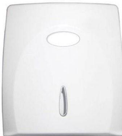
Figura 6: toalheiro tipo dispenser para papel toalha interfolhado