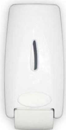
Figura 5: saboneteira tipo dispenser para sabonete líquido