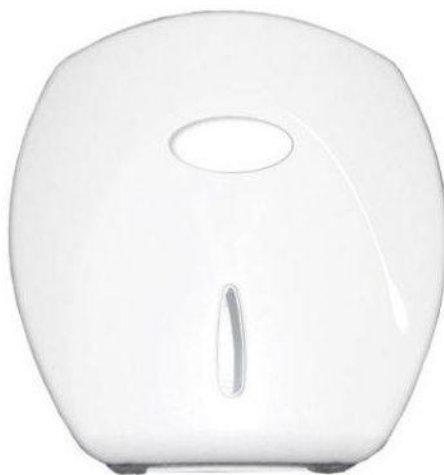
Figura 4: papelreira para papel higiênico tipo rolão

Além destes, haverá a instalação, em cada um dos sanitários, de objetos utilitários, conforme abaixo: