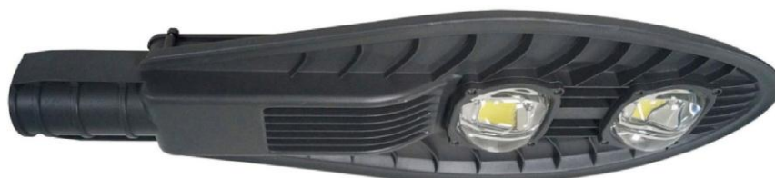
Figura 2: Luminária LED 100W para fixação em poste de iluminação pública

Haverá a instalação de novo trio de luminárias no lugar dos antigos nos 16 postes existentes, devendo este conjunto de 3 luminárias ser composto por lâmpadas de LED 100W na cor branca . Abaixo, o modelo de luminária LED escolhido para o Parque: