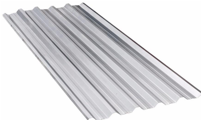
Figura 3: telha de aço zincado tipo trapezoidal

A cobertura será em laje pré-moldada, sobre a qual será instalada cobertura em telhas de aço zincado do tipo trapezoidal (espessura de 0,95 mm), com inclinação de 10%.