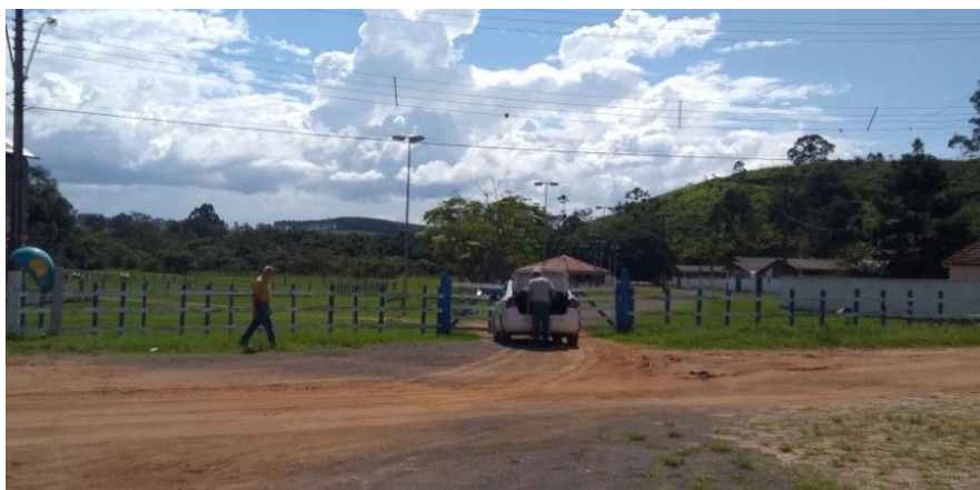
Foto 1: local de implantação do portal do Parque de Exposições de Ibertioga, em linha reta com a via de acesso e onde hoje existe uma porteira simples em madeira.

Este novo portal corresponderá a uma releitura do partido arquitetônico do portal existente, com 2 acessos laterais destinados ao público e 1 acesso central para veículos, sendo todos estes protegidos por cobertura de madeira e telhas cerâmicas coloniais.